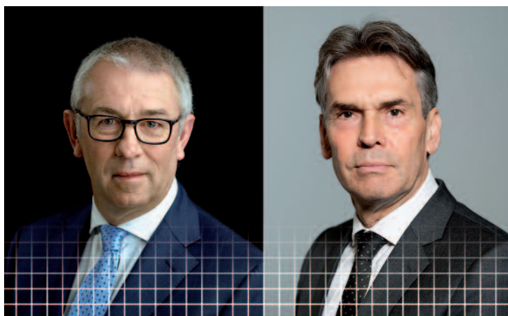
Namens de Cyber Security Raad, Eelco Blok, Dick Schoof

Eigenlijk zou een hoog cybersecurityniveau net zo vanzelfsprekend moeten zijn als hoge waterkeringen. In dit magazine geven topfunctionarissen uit overheid en bedrijfsleven hun visie op wat er nodig is om het digitale veiligheidsniveau in Nederland te verhogen.