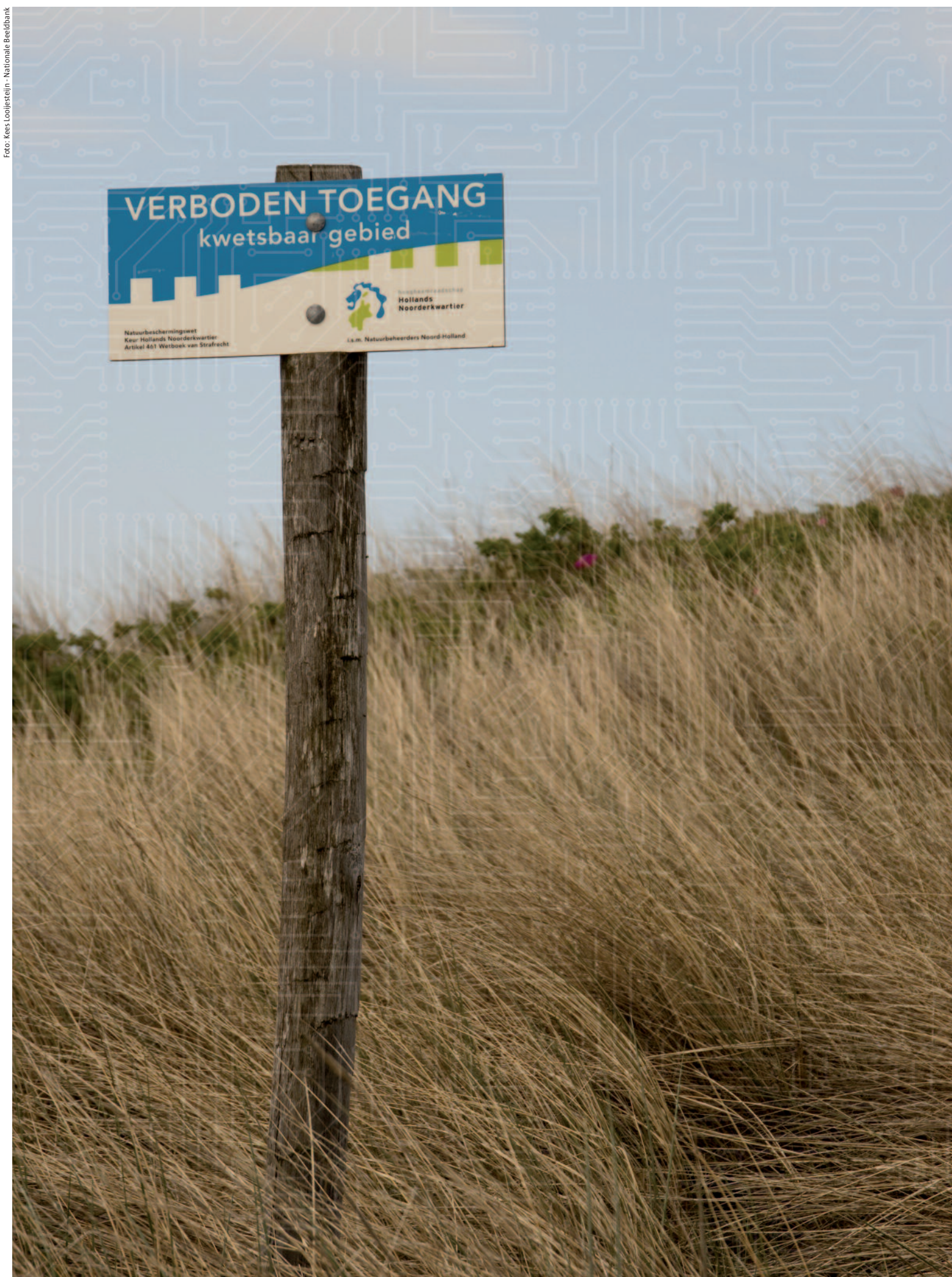
Een systeem kan nog zo goed ingericht zijn; wanneer buitenstaanders gemakkelijk fysieke toegang krijgen tot de apparatuur, medewerkers wachtwoorden op het scherm plakken of zich onvoldoende bewust zijn van de risico's, dan is het systeem kwetsbaar voor mensen die kwaad in de zin hebben.