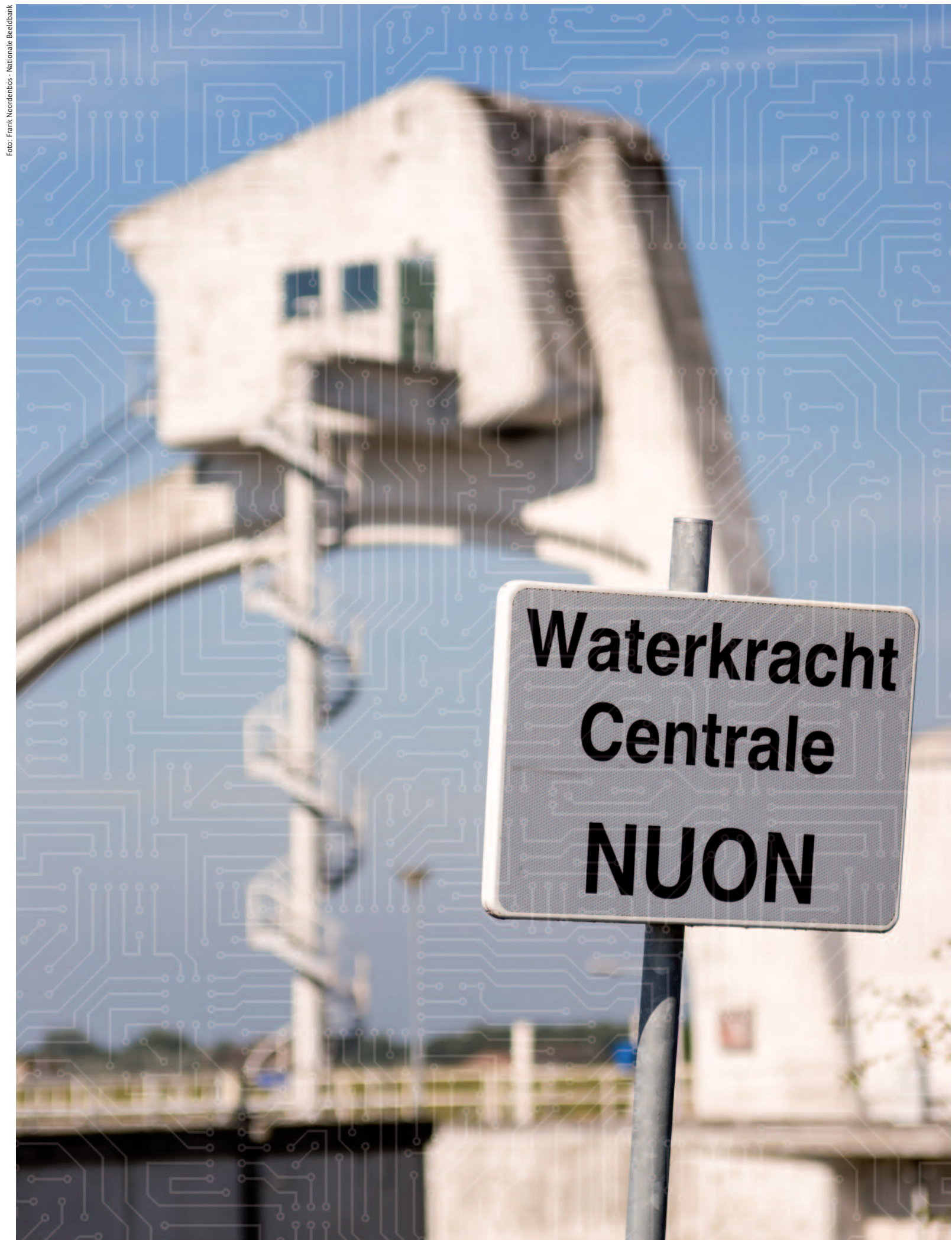
Maatwerk en gerichte acties zijn nodig voor de bescherming van de vitale infrastructuur, maar óók voor andere delen van onze economie. Bedrijven in de topsectoren, cruciaal voor het verdienvermogen van onze economie, blijken bijvoorbeeld zeer kwetsbaar te zijn voor digitale spionage.

"Nu al vormt cybercrime een flinke schadepost van vele miljarden voor de economie"