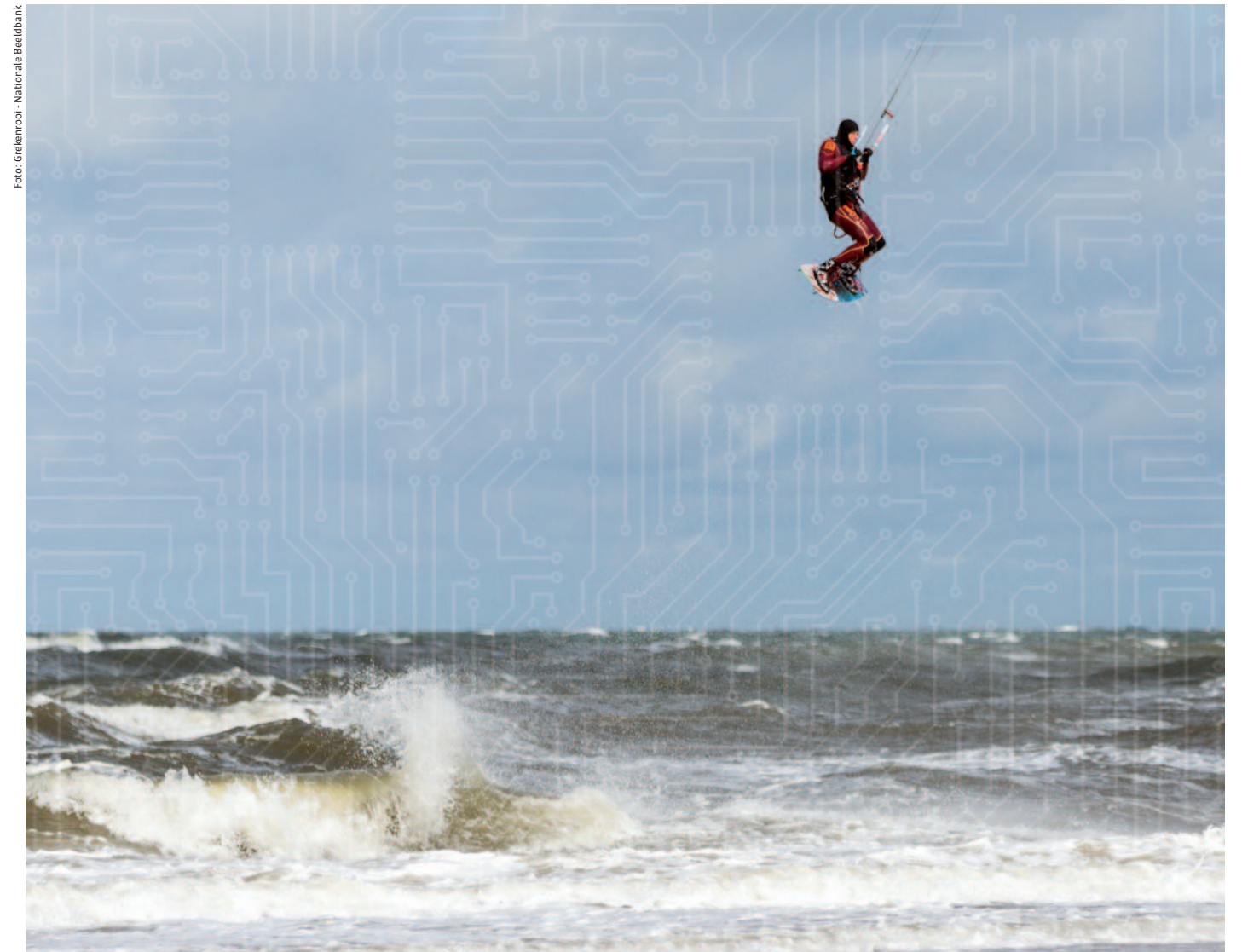
Dreigingen van vandaag zijn de reguliere criminaliteit van morgen. Wij moeten doorlopend meebewegen. Zonder structurele aandacht voor cybersecurity en gedigitaliseerde criminaliteit is deze zich telkens vernieuwende dreiging onmogelijk bij te houden.

Wat ik zorgelijk vind, is dat specialistische kennis allang niet meer nodig is voor het plegen van cybercrime. Tegenwoordig koop je op online-marktplaatsen complete pakketten waarmee je kunt hacken of een DDoS-aanval kunt uitvoeren. Inclusief goed geregelde klantenservice. Cybercrime ontwikkelt zich tot een nieuwe, criminele dienstensector. We zien ons ook steeds vaker geconfronteerd met een vermenging van criminaliteit in het fysieke en digitale domein. Op het Darkweb worden bijvoorbeeld drugs, wapens en valse identiteitsbewijzen verhandeld. Er wordt betaald met bitcoins, maar de goederen worden door pakketdiensten in de fysieke wereld afgeleverd. En de bitcoins worden weer omgezet